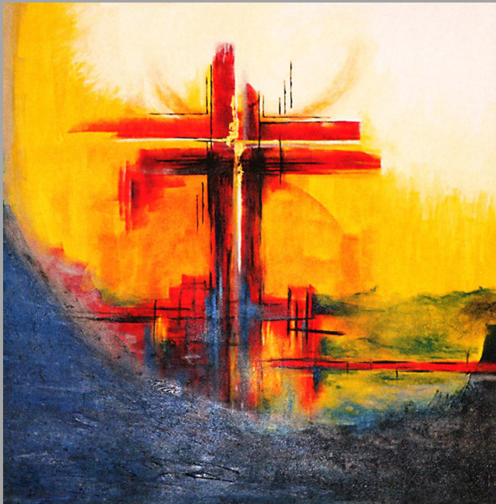
Auferstanden vom Tode – Christine Hartmann/Atelier 14 Altargemälde, Ausschnitt aus einem Triptychon, Kreuzkirche Fulda