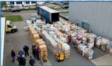
Ostrhauderfehn: Im Lager wird eine neue Hilfslieferung für den Transport verladen.

Jede Übergabe wird durch Protokolle und oft auch durch Fotos oder Videos dokumentiert, um Transparenz sicherzustellen.