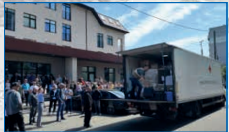
Am Ziel: Die Hilfsgüter werden immer direkt persönlich übergeben oder verteilt.