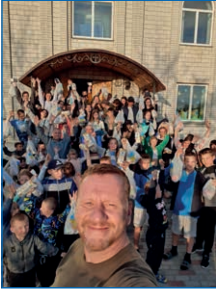
Im Kriegsgebiet: Gruppenbild mit Kindern nach der Übergabe einer Hilfslieferung

Inmitten der Zerstörung und des Leids in der Ukraine gibt es Hoffnung – und diese Hoffnung sind Sie!