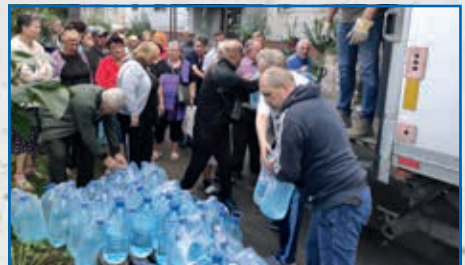
Hilfe die ankommt: Wir garantieren, dass jede einzelne Spende Bedürftige erreicht!